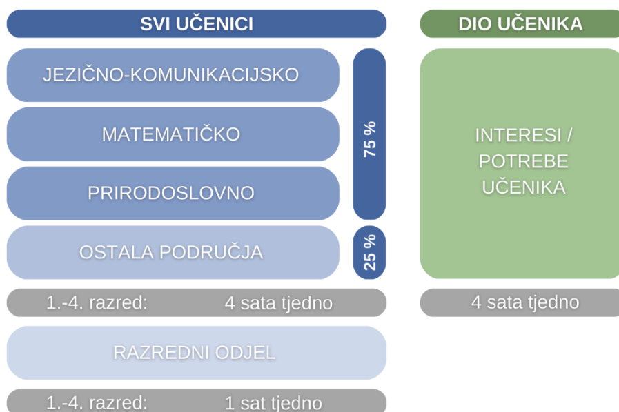
Slika 1. Struktura Programa potpore, potpomognutog i obogaćenog učenja u razrednoj nastavi A2

Struktura Programa A2 u razrednoj nastavi prikazana je na Slici 1.